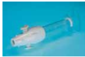
Портативная система для эвакуации содержимого полости матки — ручной шприц-аспиратор