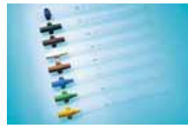
Новые виды пластмасс сочетают в себе два свойства — жёсткость юретки с мягкостью гибкой канюли